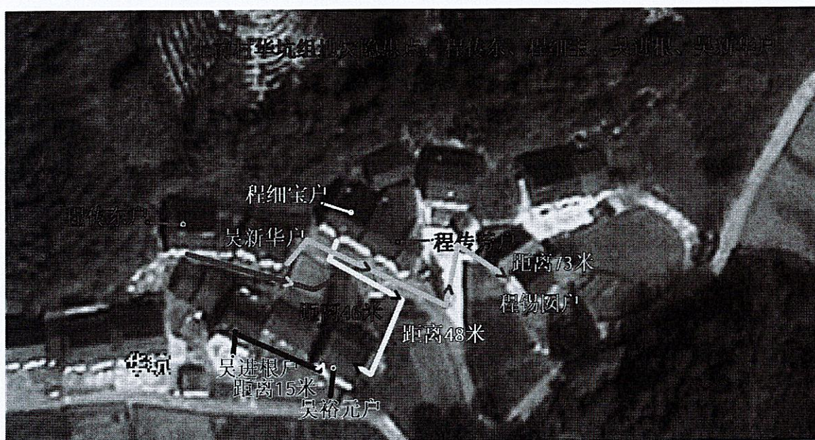
琅金村里梅川组地灾点及人员转移路线图