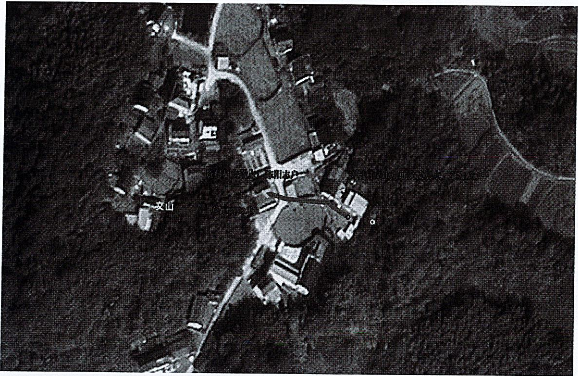
上前村汪坑组地灾点及人员转移路线图